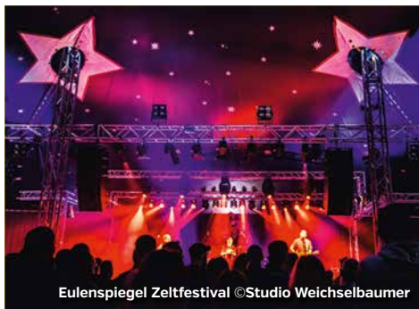
Eulenspiegel Zeltfestival