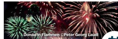
Donau in Flammen

Tourismus Passauer Land Domplatz 11 • 94032 Passau T 0851 397-600 • tourismus@landkreis-passau.de www.passauer-land.de