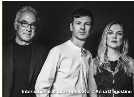
Internationales Gitarrenfestival

Stadt Deggendorf Kulturamt Franz-Josef-Strauß-Str. 3 • 94469 Deggendorf T 0991 2960 530 • F 0991 2960 539 www.deggendorf.de