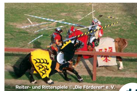
Reiter- und Ritterspiele ©,Die Förderer“ e. V.

> Aufführung „Landshuter Hochzeit 1475“: 30.06. - 23.07.