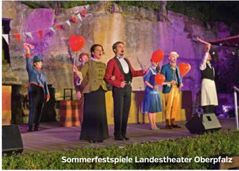
Sommerfestspiele Landestheater Oberpfalz