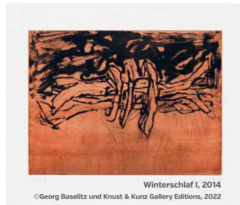
Winterschlaf I, 2014

Amberger Congress Centrum Schießstätteweg 8 • 92224 Amberg T 09621 49000 • F 09621 490010 acc@amberg.de • www.acc-amberg.de