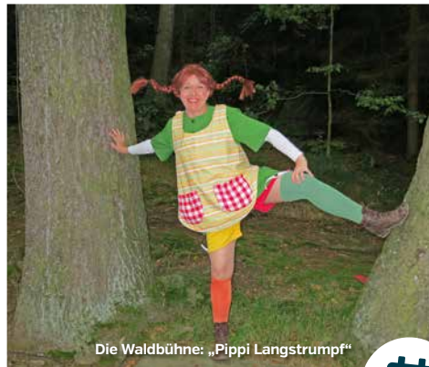
Die Waldbühne: „Pippi Langstrumpf“