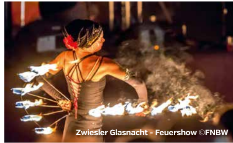
Zwiesler Glasnacht - Feuershow