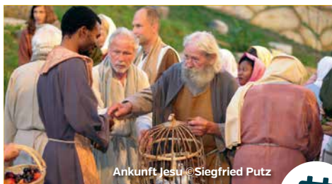
Ankunft Jesu

> Passionsspiele Perlesreut: 04.08. / 05.08. / 06.08. 11.08. / 12.08. / 13.08. / 14.08. Einlass: ab 19:00 Uhr Beginn: jeweils 20:30 Uhr