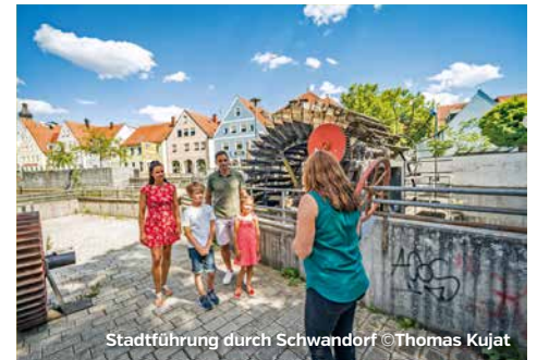
Stadtführung durch Schwandorf