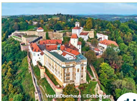
Veste Oberhaus