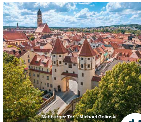
Nabburger Tor

Es folgen im Sommer das Amberger Altstadtfest, das bereits erwähnte Bergfest, Sommerfestival, Sommerserenaden, Sommer in der Stadt, Luftnacht u.v.m.