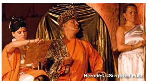
Herodes ©Siegfried Putz