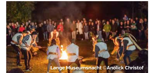
Lange Museumsnacht