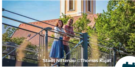
Stadt Nittenau

Tourist-Information Nittenau Hauptstraße 14 • 93149 Nittenau T 09436 902733 • F 09436 902732 touristik@nittenau.de • www.nittenau.de