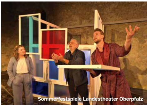
Sommerfestspiele Landestheater Oberpfalz