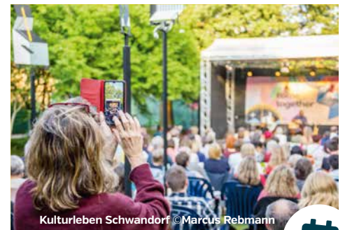
Kulturleben Schwandorf