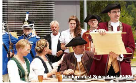
Pandurenfest Spiegelau

Ferienregion Nationalpark Bayerischer Wald GmbH Konrad-Wilsdorf-Straße 1 • 94518 Spiegelau T 0800 0008465 www.ferienregion-nationalpark.de