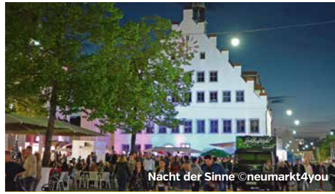
Nacht der Sinne

Erstmals fanden die Neumarkter Schmankerlwochen 1991 statt, 2023 bereits zum 33. Mal. Jedes Jahr von 01. - 31. Oktober stellen die Schmankerlwirte ein abwechslungsreiches Menü zum jährlich wechselnden Thema zusammen. Es wird vor allem auf qualitativ erstklassige, heimische Zutaten wie die Juradistl-Regionalprodukte geachtet.