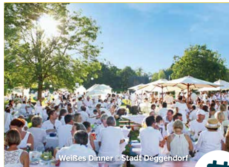
Weißes Dinner