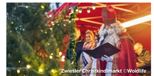
Zwiesler Christkindlmarkt