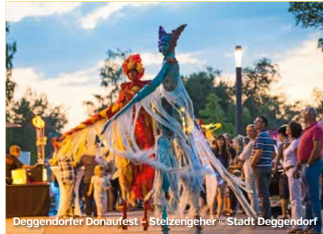
Deggendorfer Donaufest – Stelzengeher