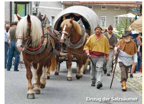
Einzug der Salzsäumer