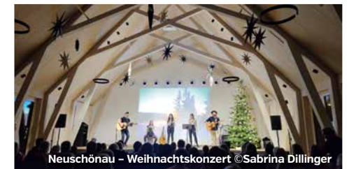
Neuschönau - Weihnachtskonzert