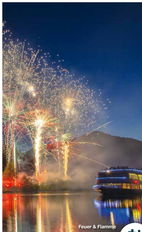
Feuer &amp; Flamme